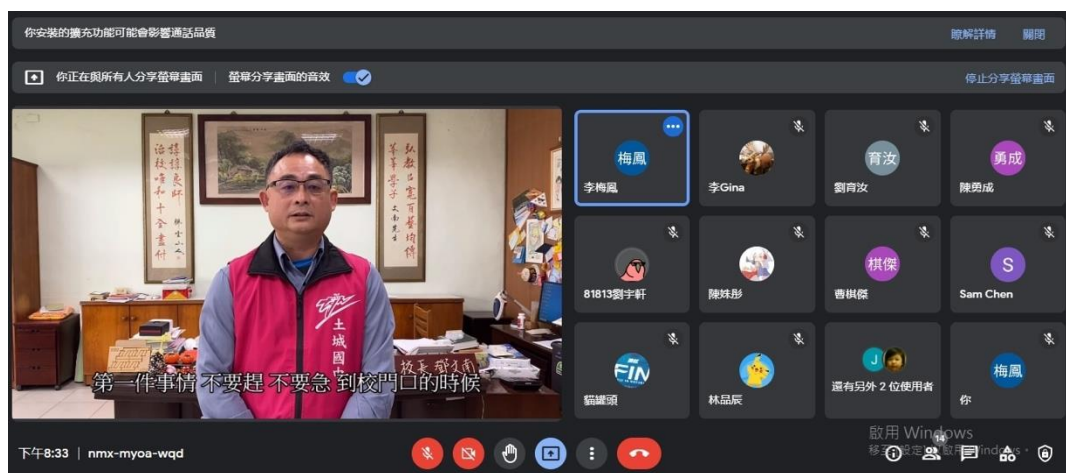
班親會開始前，各班播放校長錄製的影片給線上家長們觀看