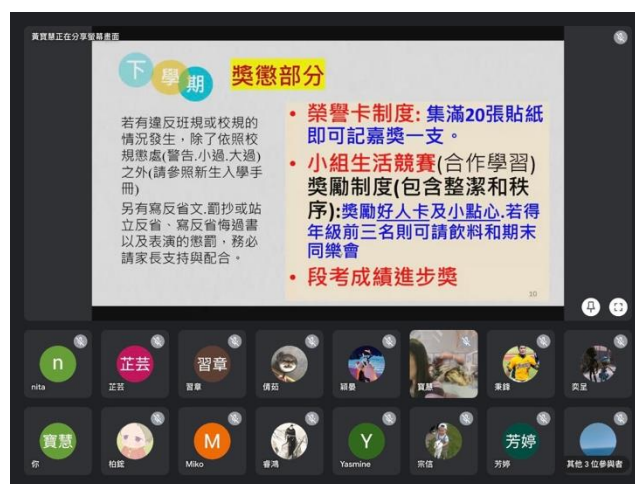
老師向家長報告班務運作狀況以及班級獎懲制度